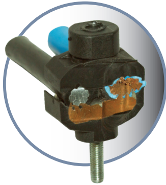
Conector KPB en corte

La información complementaria se puede obtener mediante la especificación técnica de producto ETE-085.